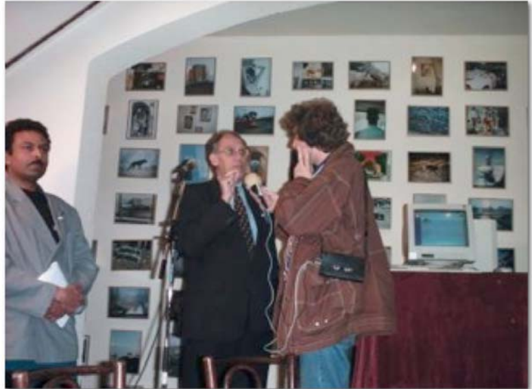
De Balie, Amsterdam, 21 Maart 1997 - Minister van Binnenlandse Zaken Hans Dijkstal en Drs. Briec-Yves Cadat, voorzitter van Stichting Magenta, openen het MDI.

Op 21 maart 1997 opende de toenmalige Minister van Binnenlandse zaken, Hans Dijkstal, met een ietwat onwennige muisklik het MDI. Hij besloot zijn toespraak bij die gelegenheid met de woorden 'Het zou het mooist zijn als er weinig gemeld zou hoeven worden'. Zo mooi werd het dus niet. Het MDI, destijds nog gevestigd in de zijkamer van de oprichters, had voor de opening debatcentrum De Balie in Amsterdam bereid gevonden ruimte ter beschikking te stellen. Ook spraakmakende digeratiï van het eerste uur van XS4all, DBNL en NLIP waren -soms tegen wil en dank- betrokken bij de oprichting. Men zat niet zo te wachten op het slechte nieuws dat discriminatie op Internet een probleem was. Bovendien had men al het Meldpunt Kinderporno op Internet opgericht en in de ogen van sommigen was kinderporno toch een meer reëel probleem. Een grote internetprovider uit die dagen liet weten: 'wij zetten geen link naar de meldpunten op onze binnenkomst pagina. We hebben er geen behoefte aan potentiële klanten weg te jagen met het nieuws dat er kinderporno en racisme op Internet staat'. Gelukkig was deze struisvogelpolitiek van korte duur.